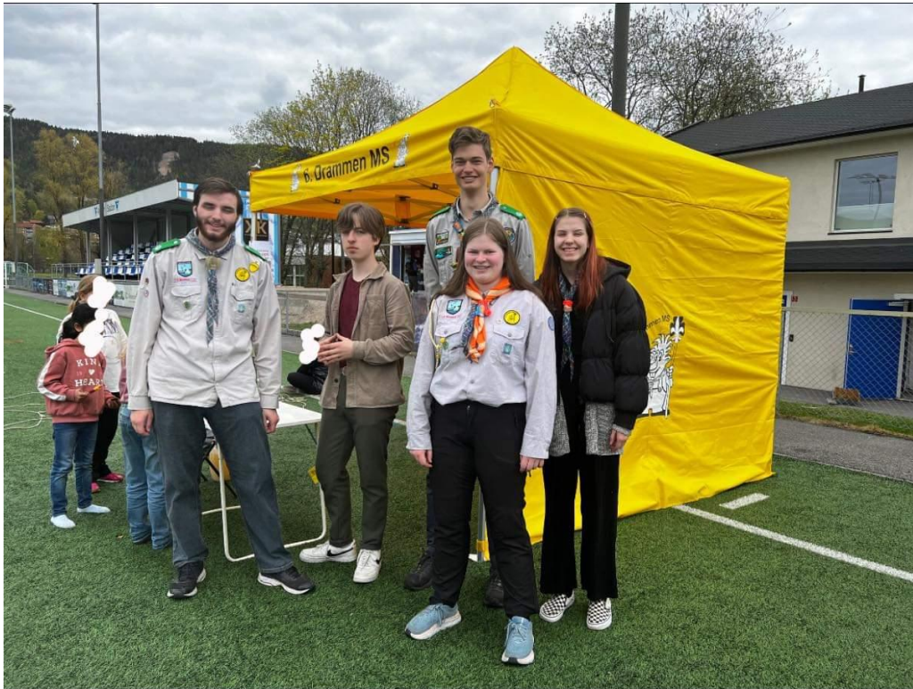
Roverne promoterer speidergruppa på Åssiadagen