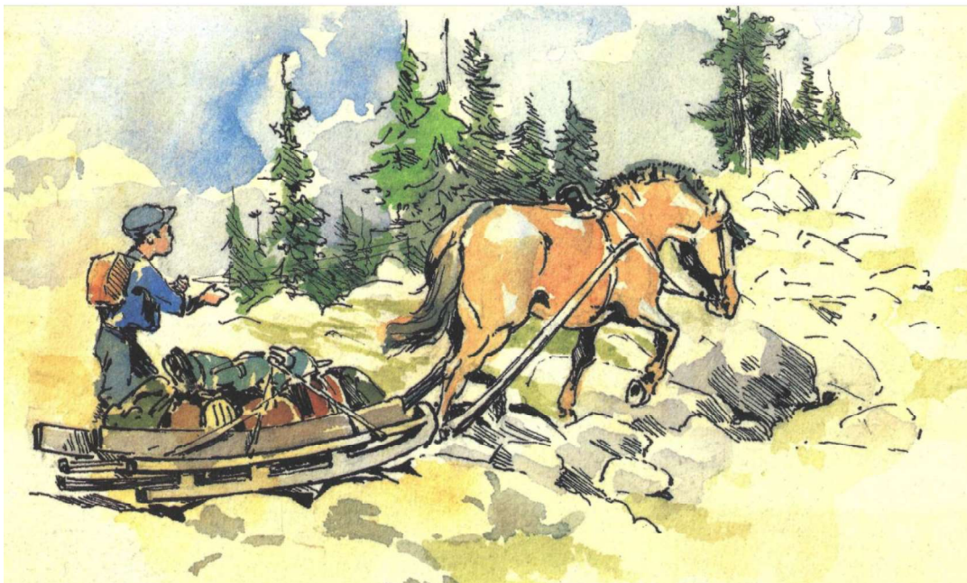
BPs illustrasjon av slep opp Atndalen, fra turen til Norge i 1912 sammen med nevøen Donald