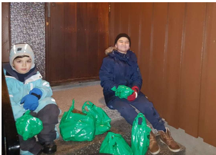
En kort runde med søppelplukking rundt speiderhuset og skolen ga fulle poser