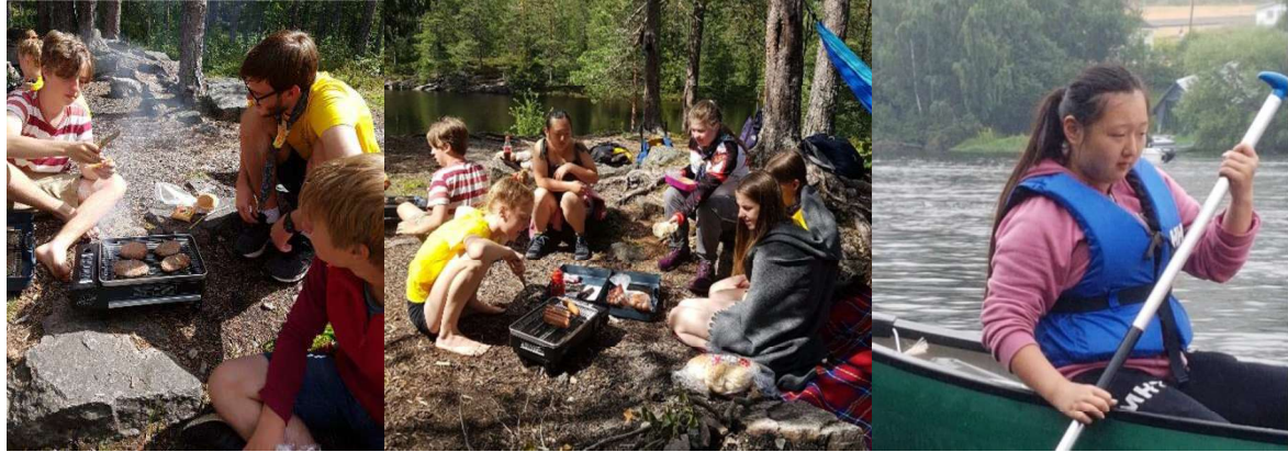
Fra årets nærleir

dammen og «sekstanten». Her ble det grilling puljevis, tatt orienterings poster i nærområdet og badet. Fjerde dag var kanotur fra Vestfossen ned Vestfosselva til Hokksund. Her var det rast ut masser langs elva flere steder. Turen gikk videre over på Drammenselva gjennom Nedre-Eiker og nedover til Landfalløybrua. Det var stopp med quiz og rast på Pålsøya.